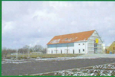
WISMUT-AUSSTELLUNG AM RITTERGUT