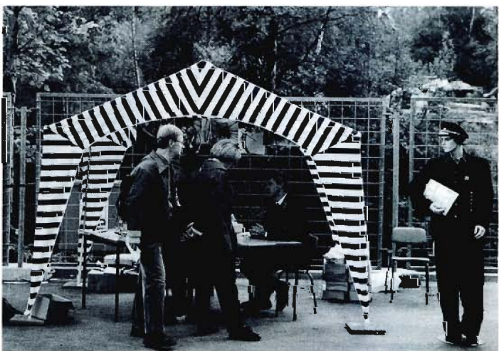
Die Wismut-Bergleute mußten viele Fragen beantworten.