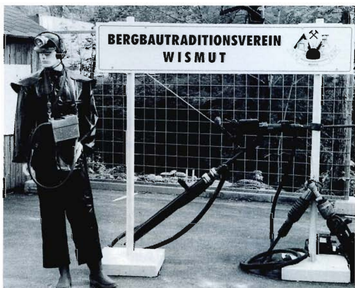
Stand des Bergbau-Traditionsvereins am Frohnauer Hammer.