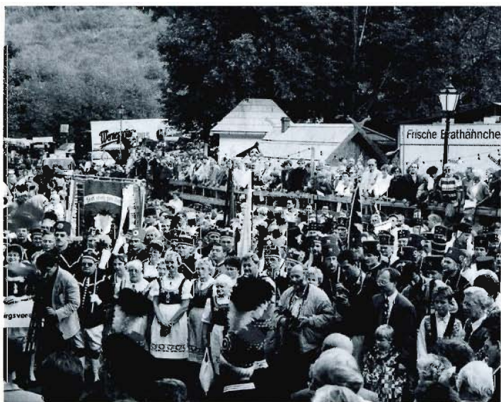
Volksfest am Frohnauer Hammer.